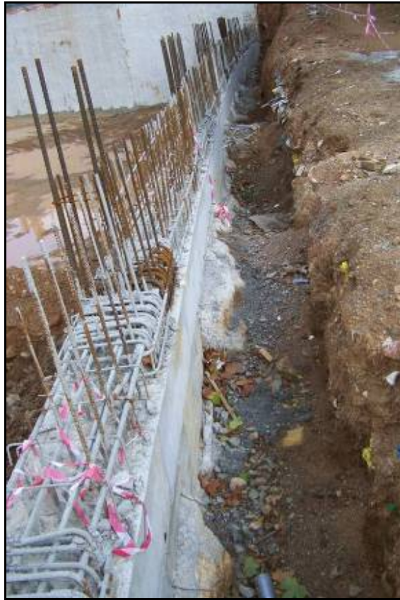
Fotografia 3: Vista parcial de la pantalla perimetral de l'obra.

Memòria de la intervenció arqueològica a l'Av. Estatut de Catalunya, 43-55, Av. Can Marçet, 1-3 i P/Valladaura, s/n, Barcelona.