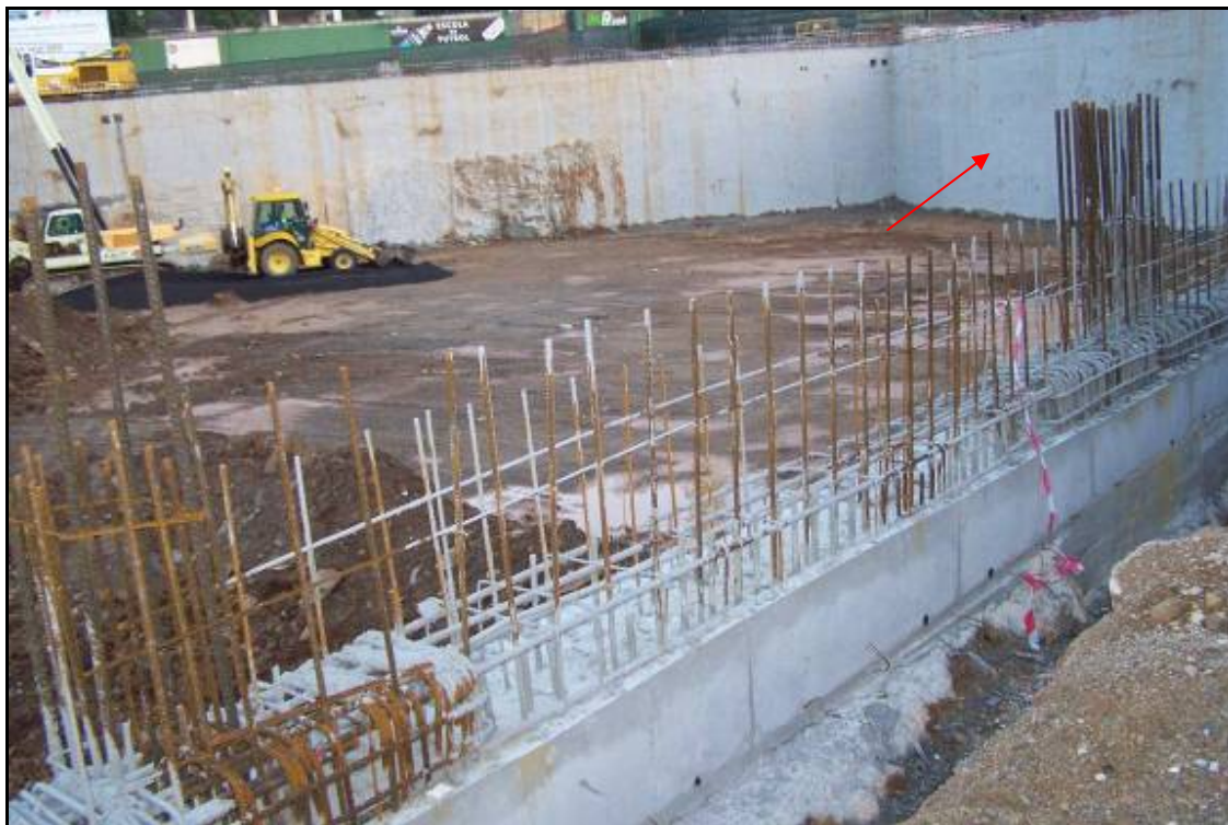
Fotografia 7: Vista general de la meitat nord-est del Sector A ja rebaixada, amb el mur de separació entre ambdós sectors senyalitzat amb la fletxa.

Memòria de la intervenció arqueològica a l'Av. Estatut de Catalunya, 43-55, Av. Can Marçet, 1-3 i P/Valladaura, s/n, Barcelona.