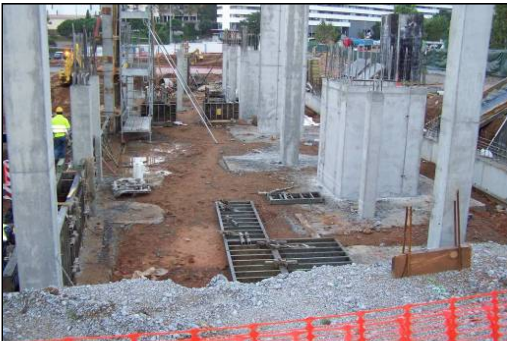
Fotografia 4: Vista general del Sector B, amb les tasques d'aixecament dels pilars i encofrats.