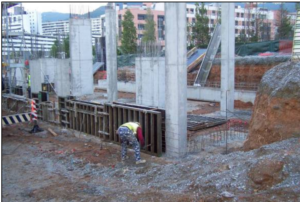
Fotografia 5: Vista del Sector B, amb les tasques d'aixecament dels pilars i encofrats.

Memòria de la intervenció arqueològica a l'Av. Estatut de Catalunya, 43-55, Av. Can Marçet, 1-3 i P/Valladaura, s/n, Barcelona.