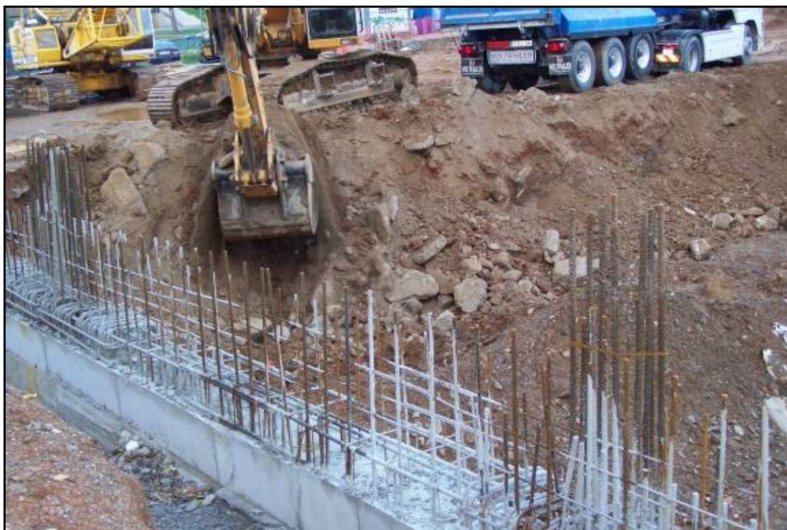
Fotografia 8: Giratòria rebaixant la meitat sud-oest del Sector A.