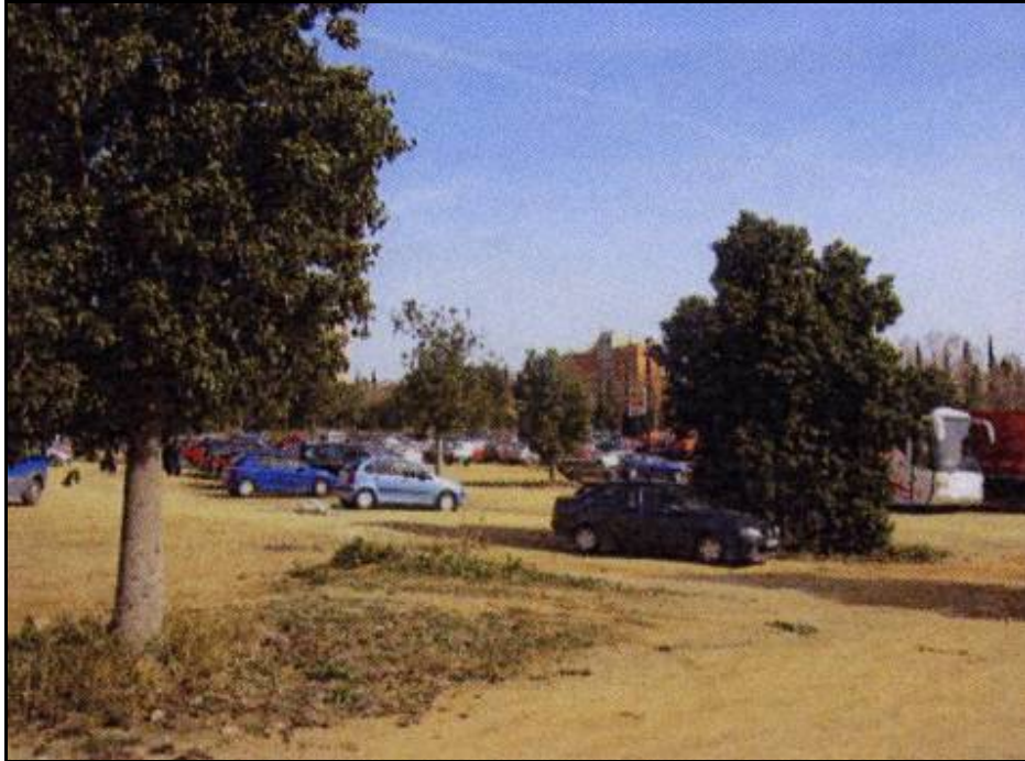
Fotografia 1: Vista parcial del solar abans de l'inici de les obres.