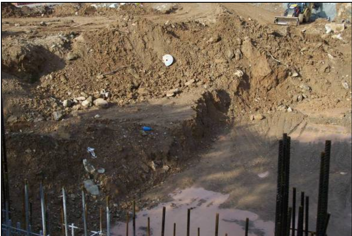
Fotografia 10: Vista general del nivell de reompliment del Sector A.