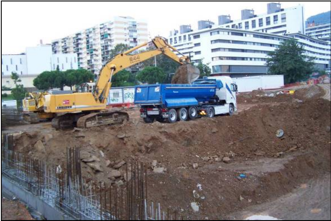
Fotografia 9: Vista general de la giratòria rebaixant la meitat sud-oest del Sector A.

Memòria de la intervenció arqueològica a l'Av. Estatut de Catalunya, 43-55, Av. Can Marçet, 1-3 i P/Valladaura, s/n, Barcelona.