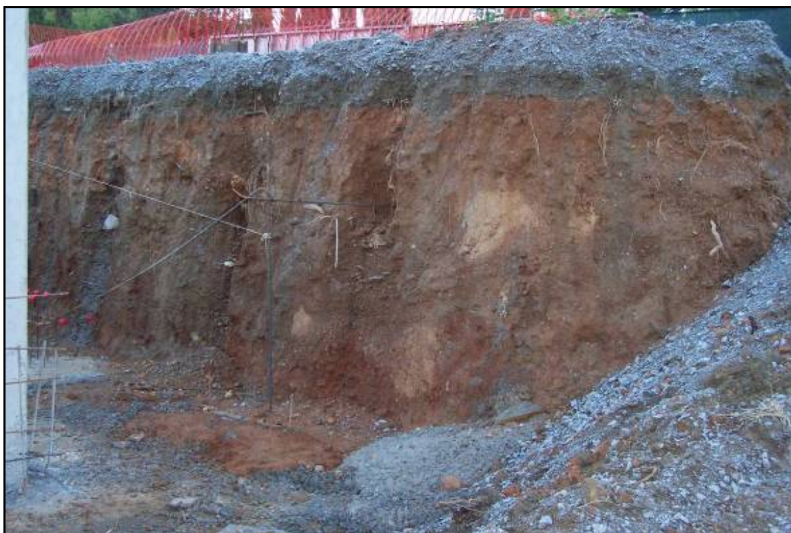
Fotografia 6: Vista parcial del tall estratigràfic del Sector B, amb el paquet de reompliment d'aquesta part del solar.