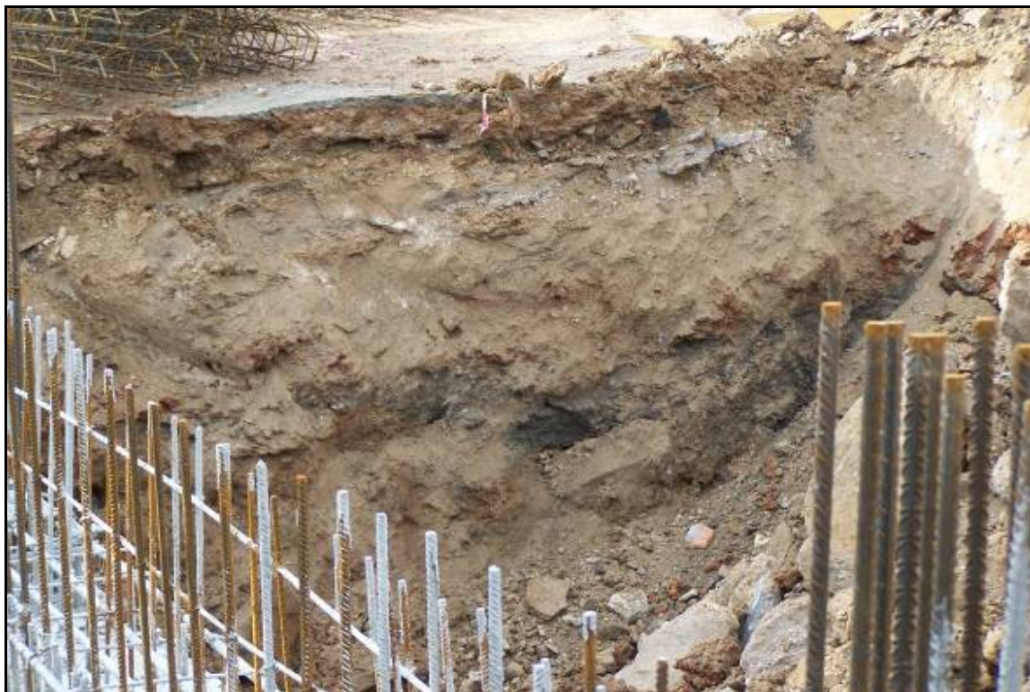
Fotografia 11: Detall del paquet de reompliment del Sector A del solar intervingut.